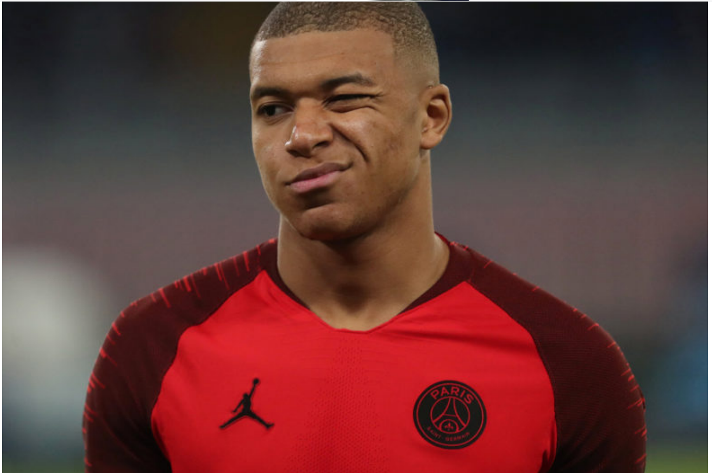
L'attaquant du PSG, Kylian Mbappe

Kylian Mbappé a été transféré à l'été 2017 de l'AS Monaco au PSG pour 180 millions d'euros: un prêt gratuit la première année, 90 millions d'euros en juillet 2018 et 55 millions d'euros en 2019, auxquels s'ajoute un bonus de 35 millions d'euros.