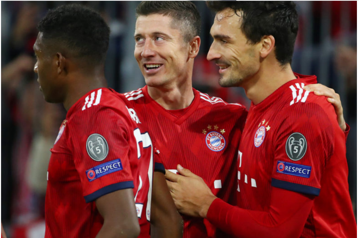
Robert Lewandowski, David Alaba et Mats Hummels, des joueurs du Bayern Munich.

Désireux d'accroître leur suprématie sur le football européen, plusieurs grands clubs du continent ont fait du chantage à l'UEFA, l'association organisant les compétitions en Europe pour les clubs. Il s'agit notamment du Bayern Munich, du Real Madrid, du FC Barcelone et de la Juventus de Turin , qui ont menacé de faire bande à part avec un projet de ligue fermée privée, réunissant les meilleurs clubs.